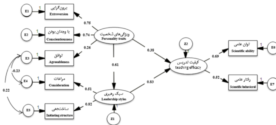
شکل ۲: مدل ساختاری پژوهش بعد از اعمال اصلاحات